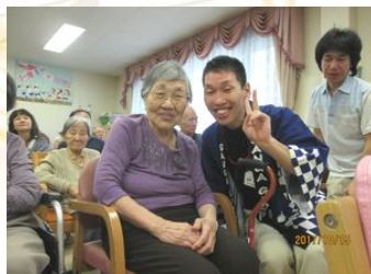
笑顔でハイチーズ