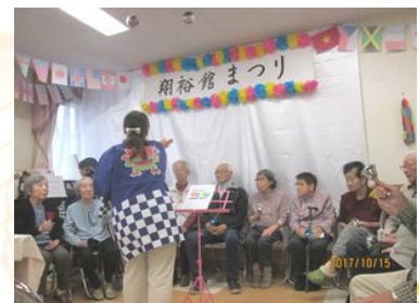
利用者様による ハンドベルの演奏