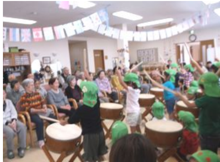
一緒に秋の歌も歌いました

10月は翔裕館まつりをはじめ、保育園交流、お誕生日会がありました。その様子を紹介させていただきます。