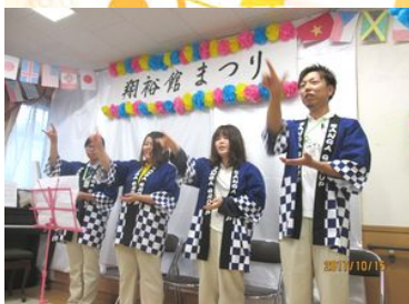
歌と手話で 「365日の紙飛行機」