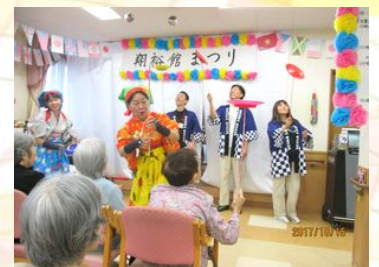
皿回し 職員も挑戦！