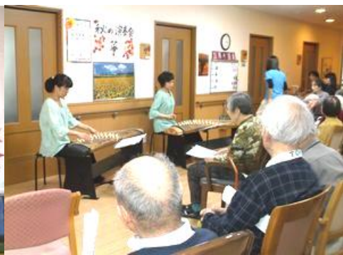
生のお箏の音色に皆さん感動しておられました。