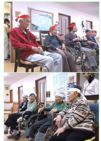
～紅組と白組に分かれて～