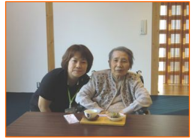
～美味しいお茶とお菓子～