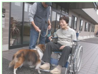
～愛犬に触れ ニッコリ笑顔～