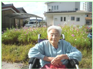
～きれいな コスモス畑～